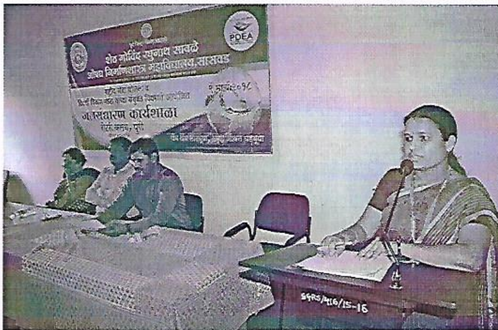
Water Conservation Workshop

[Signature] PRINCIPAL PUNE DISTRICT EDUCATION ASSOCIATION'S SETH GOVIND RAGHUNATH SABLE COLLEGE OF PHARMACY, SASWAD TAL. PURANDAR DIST. PUNE-412301.