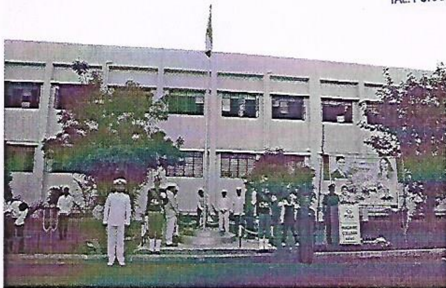
Republic Day Celebration

PUNE DISTRICT EDUCATION ASSOCIATION'S SETH GOVIND RAGHUNATH SABLE COLLEGE OF PHARMACY, SASWAD TAL. PURANDAR DIST. PUNE-412301.