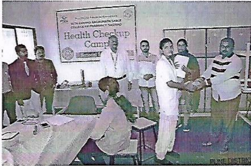
Health Check up Camp

[Signature] PRINCIPAL PUNE DISTRICT EDUCATION ASSOCIATION'S SETH GOVIND RAGHUNATH SABLE COLLEGE OF PHARMACY, SASWAD TAL. PURANDAR DIST. PUNE-412301.