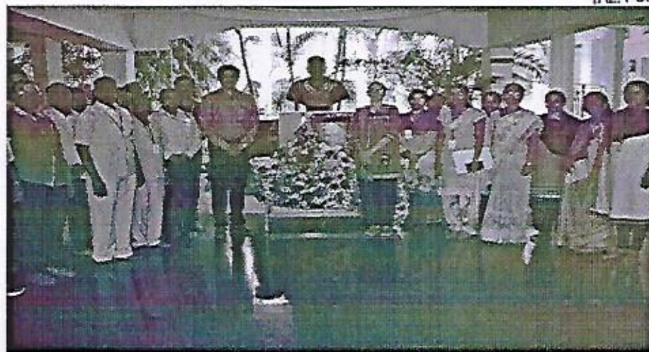
Yeshwantrao Chavan Jayanti

[Signature] PRINCIPAL PUNE DISTRICT EDUCATION ASSOCIATION'S SETH GOVIND RAGHUNATH SABLE COLLEGE OF PHARMACY, SASWAD TAL. PURANDAR DIST. PUNE-412301.