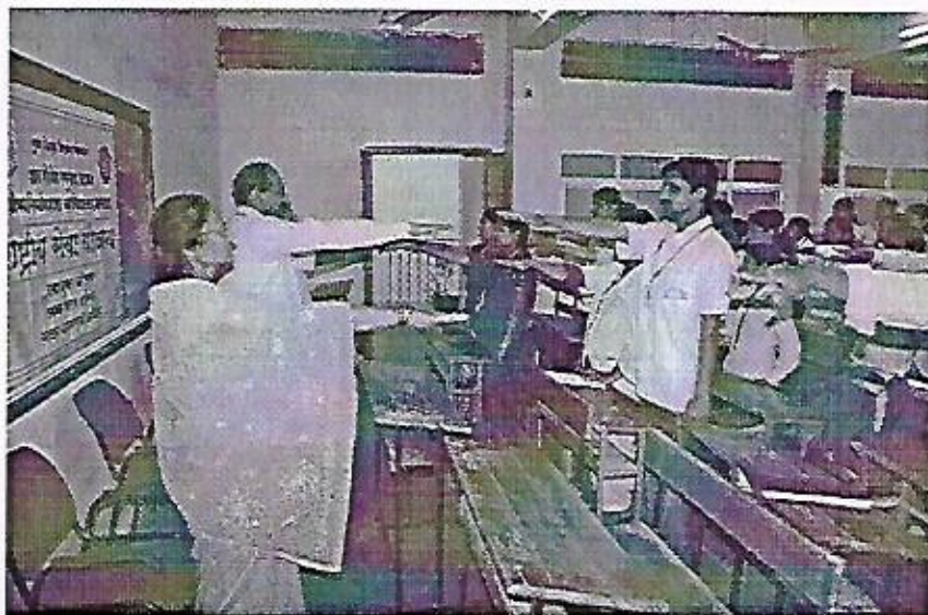
Matadan Janjagruti Mohim