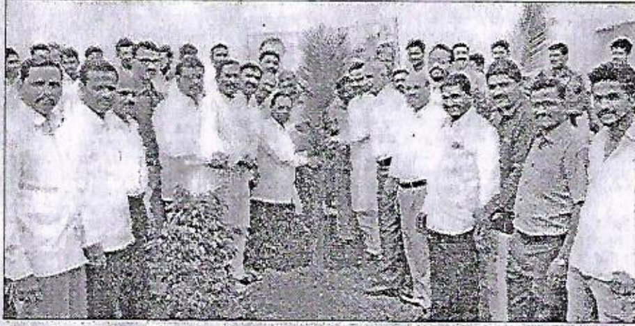
सासवड (ता. पुरंदर) : अजित पवार यांच्या वाढदिवसानिमित्त वाधिरे महाविद्यालयात वृक्षारोपण करताना मान्यवर.