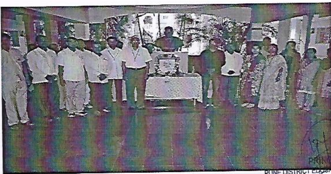
Mahatma Gandhi Jayanti

[Signature] PRINCIPAL PUNE DISTRICT EDUCATION ASSOCIATION'S SETH GOVIND RAGHUNATH SABLE COLLEGE OF PHARMACY, SASWAD TAL. PURANDAR DIST. PUNE-412301.